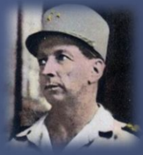
Général BROSSET Commandant la 1ère D.F.L.