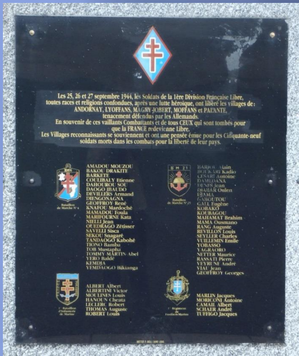
Plaquette commémorative au cimetière de Lyoffans comportant la liste des soldats morts pour la France des Unités de la 1 ère D.F.L dans les combats de la Libération de : Andornay, Lyoffans, Magny-Jobert, Moffans et Palante

B.M. 4 - B.I.M. - B.M. 21 - - 1 er R.F.M. -