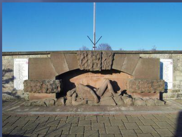
Magny-d'Anigon- Rue de la Tille, adossé au mur d'enceinte du cimetière communal :

L'après-midi des fusants éclatent au-dessus de Magny-Jobert et les Français bombardent le point d'appui des Baraques. » (...)